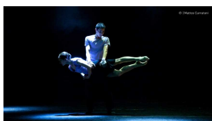
Le Quattro Stagioni

Una delle più interessanti compagnie di danza italiane insieme ad uno dei più apprezzati coreografi per un classico della musica e della danza occidentali.