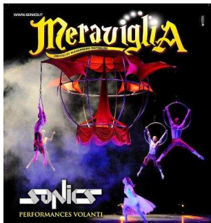
Il manifesto dello spettacolo Meraviglia dei SONICS