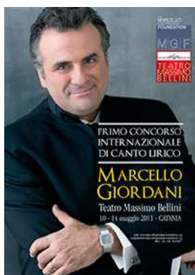
Il manifesto della prima edizione del "Concorso Internazionale di Canto Marcello Giordani"